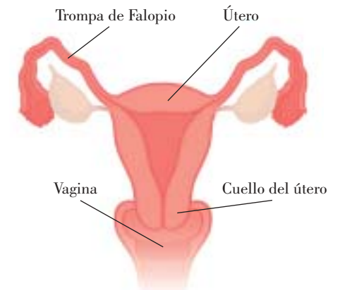
Órganos reproductor femenino

El procedimiento Essure consiste en colocar un pequeño dispositivo flexible dentro de cada una de las trompas de Falopio. Una vez colocados, se desarrolla un tejido fibroso alrededor de los dispositivos que obstruye las trompas en un período de tres meses. El bloqueo de las trompas tiene por objeto impedir que el espermatozoide encuentre y fecunde al óvulo, y, por consiguiente, impide el embarazo.